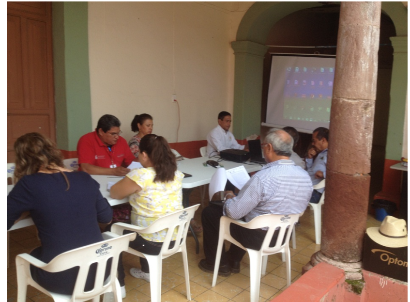
Aspecto reunión COFOR Costa-Sierra Occidental, 8 de agosto del presente año.